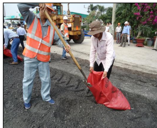
Lấy mẫu vật liệu lớp cào bóc tái chế