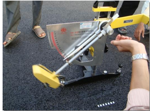
Đo độ nhám bằng con lăn Anh