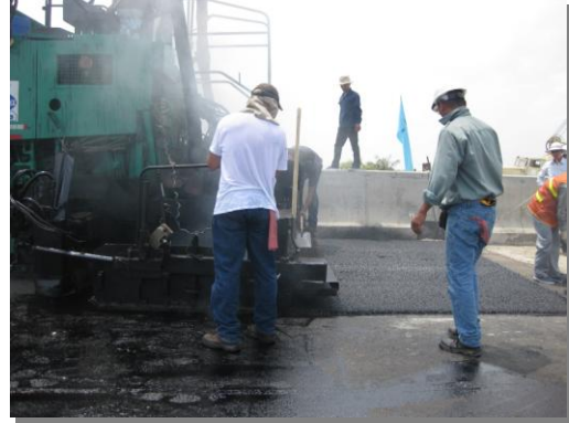
Thảm lớp BTN tạo nhám No va Chip