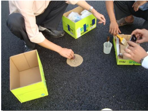
Đo độ nhám bằng phương pháp rắc cát